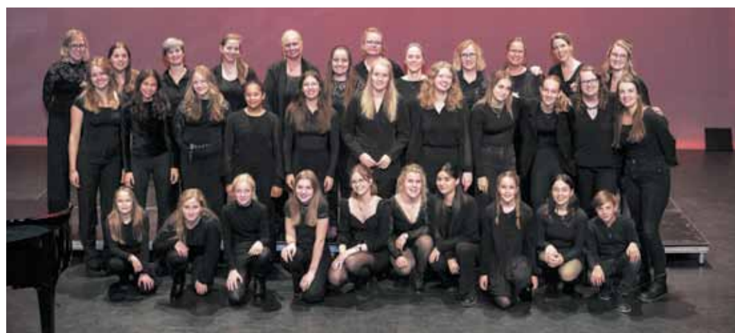
De Ulfte Nachtegalen staan 30 juni in het Openluchttheater.

Het Zomerconcert begint om 15.00 uur. Entree 15 euro, kinderen tot en met 12 jaar gratis. Tickets te verkrijgen bij de ingang of via www.openluchttheater-engbergen.nl/agenda/zomerconcert-ulfte-nachtegalen/ Tickets zijn ook te koop bij Lukassen Diervoeders, Hutteweg 2-4, in Ulft en By Josa, Grotestraat 49, Gendingen.